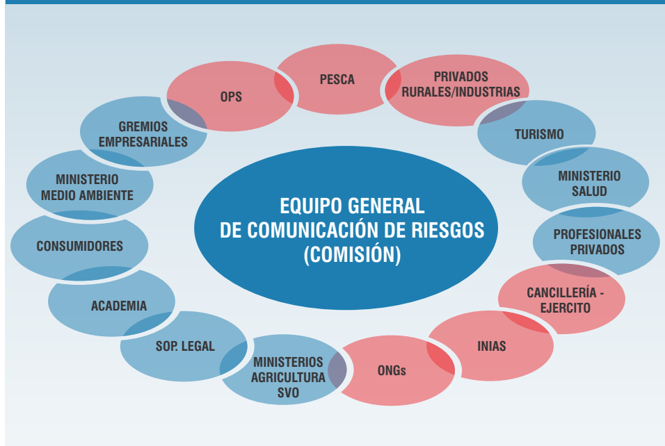
Gráfico 2: Instituciones que forman la COMISIÓN del equipo de CR

En color “rojo” se muestran las instituciones que se invitarán como observadores en casos puntuales de CRISIS DE EMERGENCIA a definir por cada país.