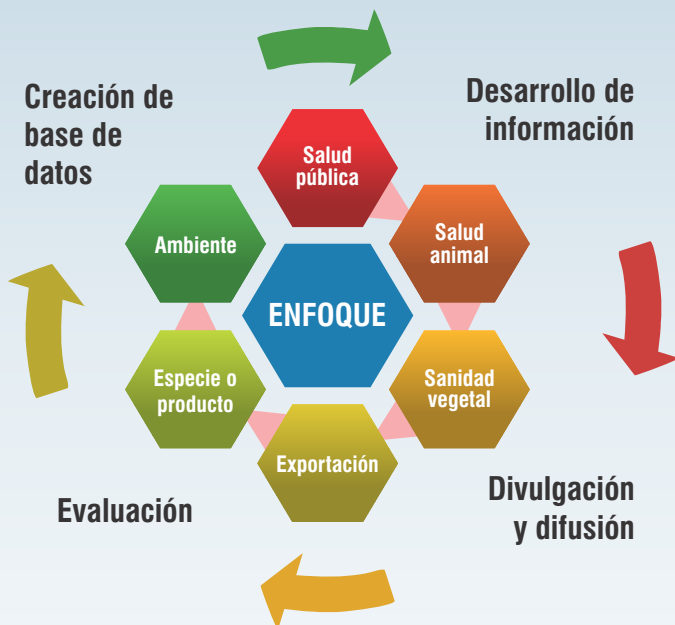
Gráfico 1: Etapas necesarias de la comunicación de riesgos