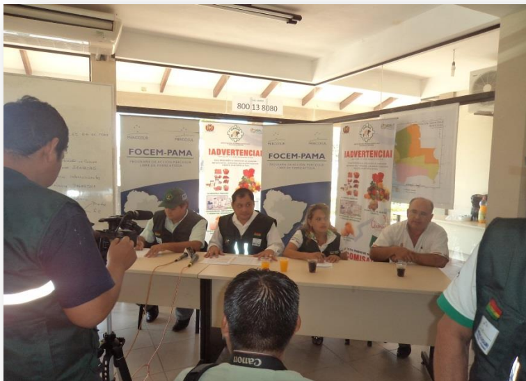
Una vez concluida la serología se emitirán resultados oficiales