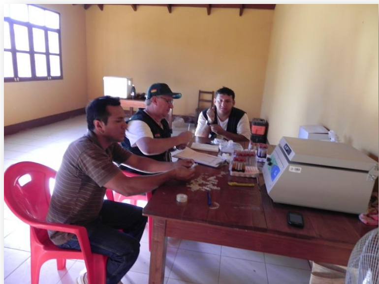
Muestreo Estudio Complementario