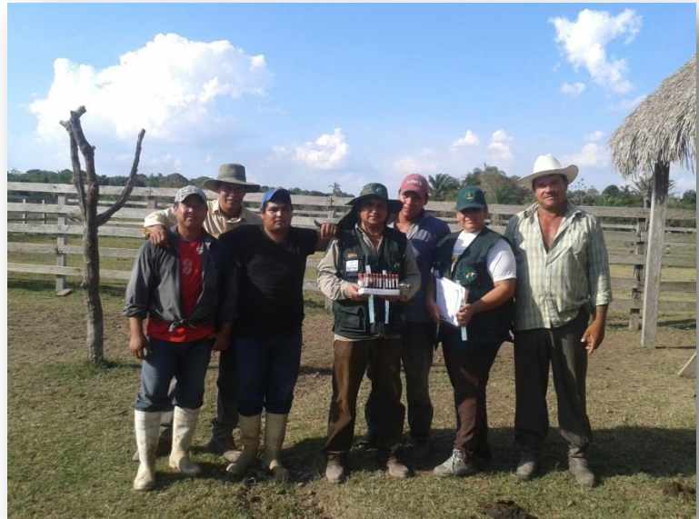
Trabajadores de los predios comprometidos con la serología

Se considerará concluida la serología, una vez emita el laboratorio el último resultado de los estudios complementarios y su respectivo análisis e interpretación de los resultados, este último se realizara en forma SENASAG PANAFTOSA.