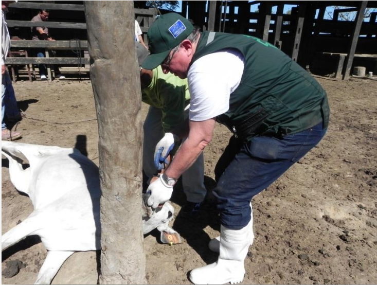
Muestreo Estudio Complementario

Hasta la semana N°5, se realizaron 19 estudios complementarios, 14 en el departamento de Santa Cruz y 5 en el departamento de Beni..